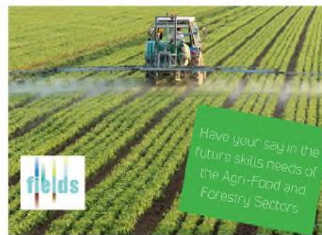
Figure 2. Images à utiliser sur les médias sociaux et les plateformes web pour promouvoir l'enquête